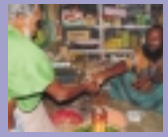
এই দোকান আমার জীবনে পরিবর্তন এনেছে

৩. নারীদের ভূমিকা ও বক্তব্য : b`i`x`i`v` Av`i`B`D`V`R` m`m`i`i` G`K` Z`Z`x`q`w`k`| Av`i`B`D`V`R`t`Z` AskM`i`Y`i` d`t`j` b`v`i`x`i` `i` `i`Z`v` e`x` t`c`i`q`i`Q` Ges w`K`i` Kg`i`-`v`bi` d`t`j` Z`v`i` A`v`t`q`i` D`b`u`Z` N`i`t`U`Q`| K`v`R`B` c`w`e`v`i` A`b`-`v`b` m`m`i` I` G`j`K`v`e`m`k` Z`v`i` n`b`v`b` I` -`K`v`Z` w`i`q`_`v`K`| Z`v`i`v` g`u`j`v`i` A`b`K`j` M`v`f`E`K` G`A`B`v`R`G` Kg`P`i` O`i`v` j`v`f`e`b` n`i`Q`| t`K`D` t`K`D` Av`i`B`D`V`R`i` m`m`i`c`-`e`-`e`n`v`i` K`i`i` Z`v`i` t`Q`i`t`j` i` b`Z`b` t`c`k`v`m`S`v`S`-c`O`Y`I` c`v`l`q`v`i` e`e`-`v`K`i`t`Q` h`v`Z` Z`v`i` Av`i` g`v`Q` a`i`Z` b`v`n`q`|